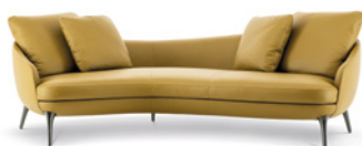
02 RAPHAEL DIVANO INCLINATO CM 247X135 H88