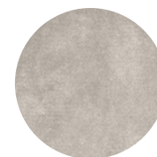
08 DIBBETS TAPPETO Ø CM 450