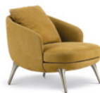
03 RAPHAEL POLTRONA CM 74X86 H78