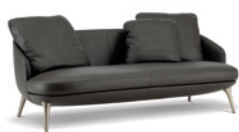
01 RAPHAEL DIVANO CM 192X91 H88